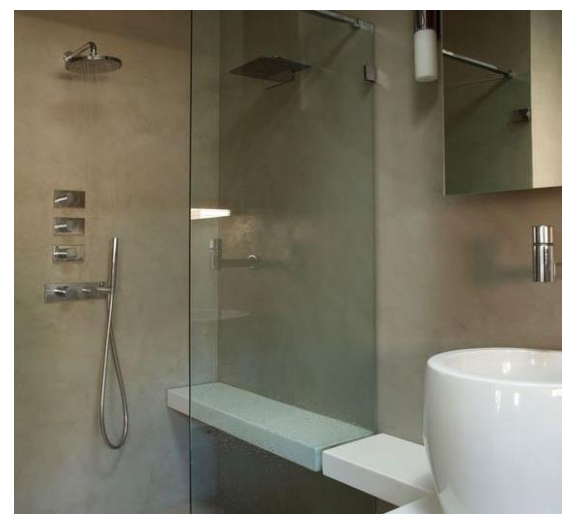
Sonderfarbe Nouveau Cendre