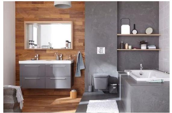
Betongrau dunkel (013)